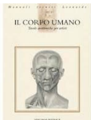
Figure Vinciana Editrice - Il corpo umano - Tavole anatomiche per ...

Il corpo umano. Tavole anatomiche per artisti - Libri , Panoramica del libro. "Se l'artista non ha una esatta cognizione dello scheletro, corre rischio di collocare fuori sito le ossa e le membra; laddove bozzando ... amazon it/corpo-umano-Tavole-anatomiche-artisti/dp/8886256841