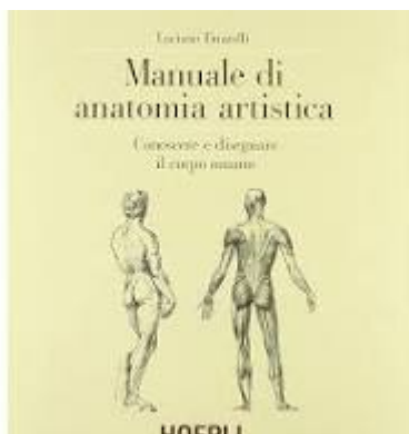
Figure Amazon.it: Il corpo umano. Tavole anatomiche per artisti - Libri

IL CORPO UMANO: TAVOLE ANATOMICHE PER ARTISTI ... , 7 Mar 2022 — Ogni singola tavola presenta la numerazione, l'indicazione della parte illustrata e la sua nomenclatura anatomica; in tal modo l'utilizzo delle ... artislireblog com/il-corpo-umano-tavole-anatomiche-per-artisti-in-un-prezioso-volume/