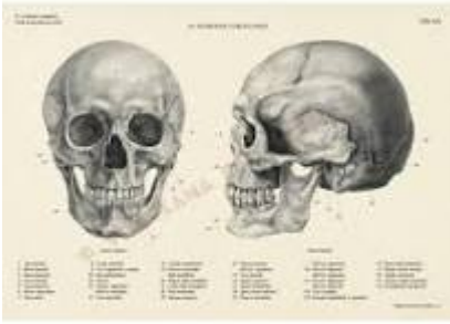
Figure Vinciana Editrice - Il corpo umano - Tavole anatomiche per ...

I Disegni di Anatomia di Leonardo da Vinci - PATRIMONI D'ARTE , Language. Italian · Publisher. Vinciana Editrice · Publication date. 1 Jan. 1997 · Dimensions. 20 x 20 x 20 cm · ISBN-10. 8886256841 · ISBN-13. 978-8886256841 · See ... patrimonidarte.com/2020-12-21-i-disegni-di-anatomia-di-leonardo-da-vinci/#:~:text=L'intento principale era per,comuni a tutti gli uomini