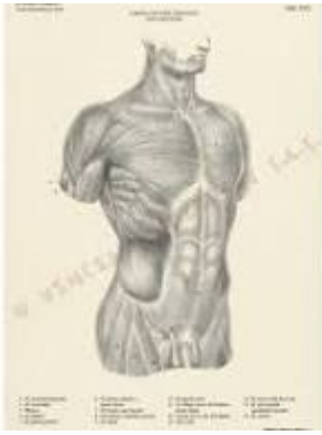
Figure Vinciana Editrice - Il corpo umano - Tavole anatomiche per ...

Vinciana Editrice - Il corpo umano - Tavole anatomiche per ... , Ogni singola tavola presenta la numerazione, l'indicazione della parte illustrata e la sua nomenclatura anatomica; in tal modo l'utilizzo delle tavole è ... novarabellearti it/prodotto/vinciana-editrice-il-corpo-umano-tavole-anatomiche-per-artisti/