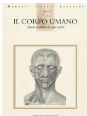
Figure Vinciana Editrice - Il corpo umano - Tavole anatomiche per ...

Cosa ha scoperto Falloppio? Observationes anatomicae di Falloppio Con la pubblicazione delle sue Observationes anatomicae nel 1561, Falloppio indagò la struttura dell'orecchio, quello delle ossa e degli organi, nonché l'apparato riproduttore, scoprendo poi la configurazione l'esatta delle trombe uterine che presero quindi il suo nome.